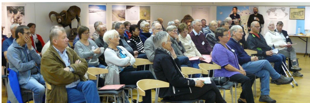
Noen av seminardeltagerne som fulgte engasjert med hele tiden.

Dette arbeidet ble ledet fra Harstad. Dermed fikk og Harstad-regionen kjennskap til offentlig administrasjon. Det ble mange kommende rådmenn som ble opplært her.